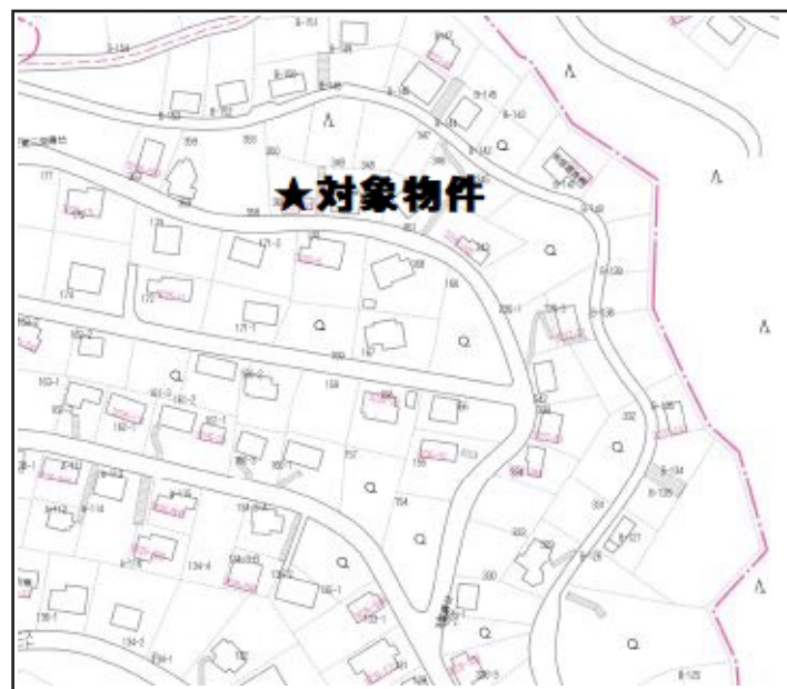
ゼンリン P20 G-4